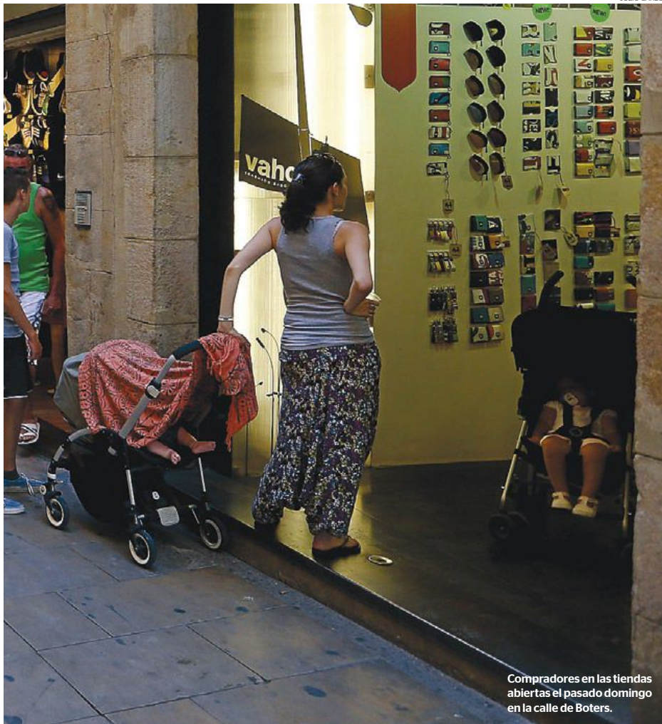
Compradores en las tiendas abiertas el pasado domingo en la calle de Boters.