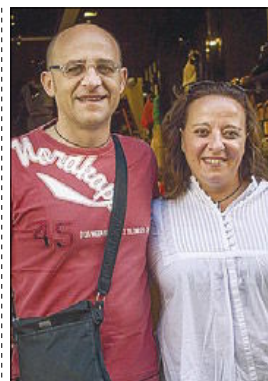
LUCIA SAVARESE/LUCA GALEOTTI ITALIA

«Desde el punto de vista del turista es mejor que permanezcan abiertas todos los días. Lo que me gusta más de aquí son las pequeñas tiendas vintage en el centro de la ciudad».