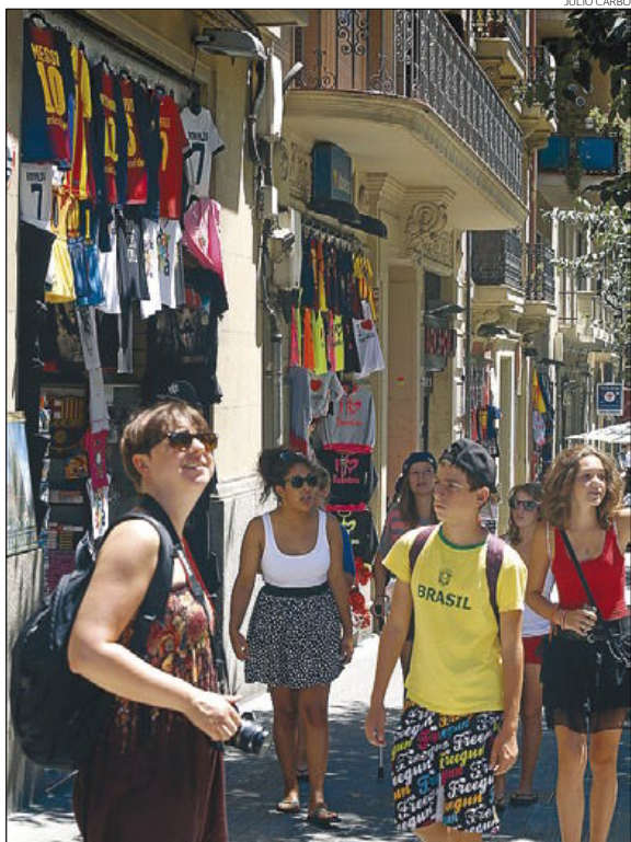
Establecimientos abiertos en la calle de Marina el pasado domingo.